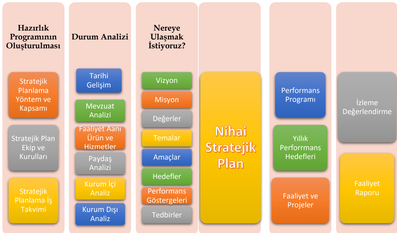
Şekil 1: İl M.E.M Stratejik Planlama Modeli

Çankırı İl Milli Eğitim Müdürlüğü plan çalışmalarında tüm paydaşların etkin katılımının sağlanması, eğitim adına öncelikler oluşturulması ve bakanlığımızın oluşturduğu tema başlıklarını destekleyecek bir yapı içerisinde olunması benimsenmiştir.